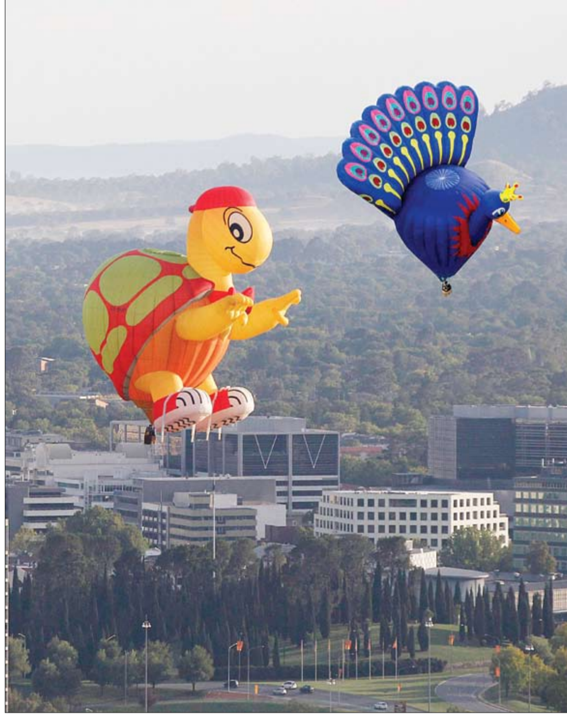
منطادان أحدهما على هيئة سلحفاة والآخر على هيئة طاووس يطفوان فوق الحي المالي في كانبيرا ضمن مهرجان البالونات السنوي الذي يتزامن مع الذكرى الثوبية للمدينة الأسترالية.

وبالإضافة إلى ذلك، يُفضل أن توفر مساند الأذرع بالمقعد إمكانية تعديل طولها وفقاً لحجم كل موظف.